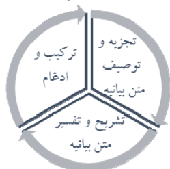
شکل ۱: مراحل سه‌گانه روش کُدگذاری در تحلیل مضمون براون و کلارک؛ ترسیم‌نگارنده

بنابراین، در این پژوهش روش تحلیل مضمون با روی‌کرد براون و کلارک چنین انجام شده است: